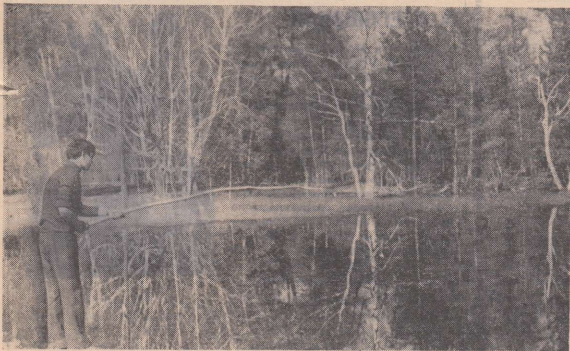
Ловись, рыбка, большая и маленькая.